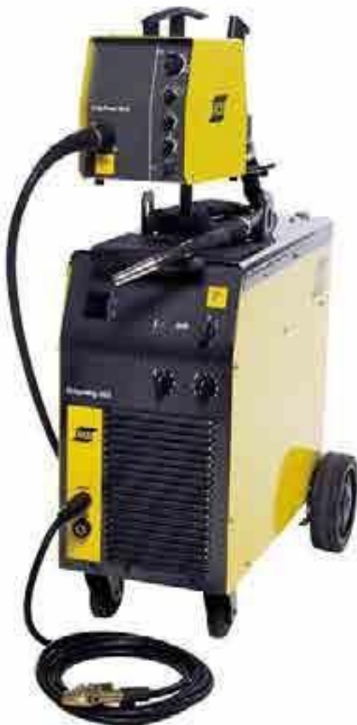
Origo Mig L405 con Alimentador de alambre Origo Feed L304

Paquete de soldadura seguro y fácil de usar.