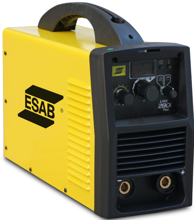
LHN 280i Plus

El inversor de soldadura LHN280i Plus es compacto e indicado para los servicios de herrería, reparación y mantenimiento leve.