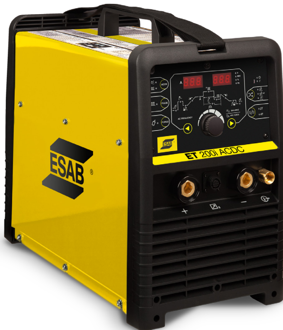
ET 200i AC/DC

La ET200i AC/DC es una máquina completa, con todos los recursos para soldadura TIG y Electrodo.